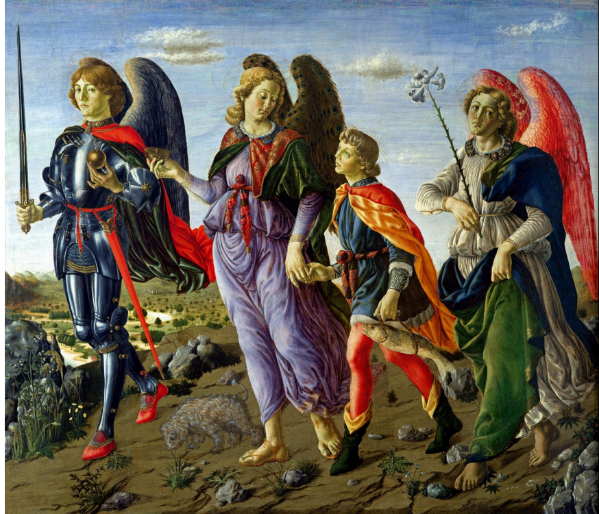
Botticini – Trois Archanges et Tobie.