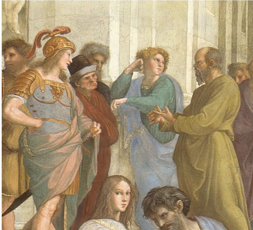
Raphael – Détail de l'« École d'Athènes ».