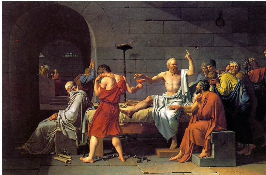
David – La mort de Socrate.