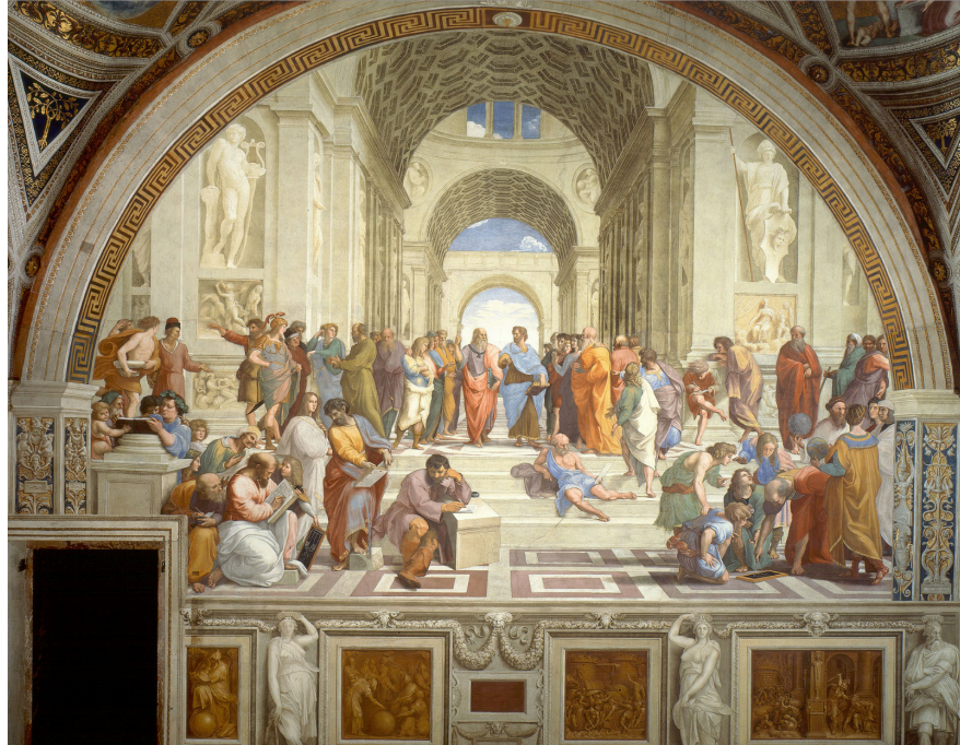
Raphael – École d'Athènes.