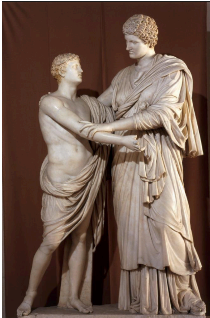
Ménélaos – Électre et Oreste.